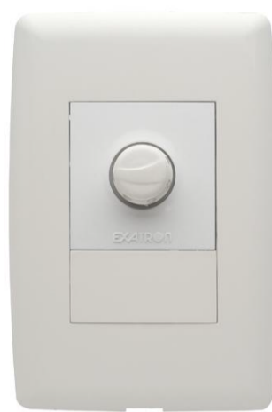
PRODUTO NÃO ENERGIZADO