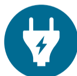
Tabela de Cargas